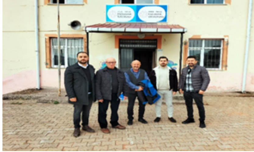
AKKUŞ KIZILELMA İLKOKULU/ORTAOKULU

Ünye Rehberlik ve Araştırma Merkezi olarak sorumluluk bölgemiz olan Akkuş ilçemizde rehber öğretmeni olmayan ve özel eğitim sınıfı bulunan okullarımızı ziyaret ederek müşavirlik hizmeti verilmiştir.