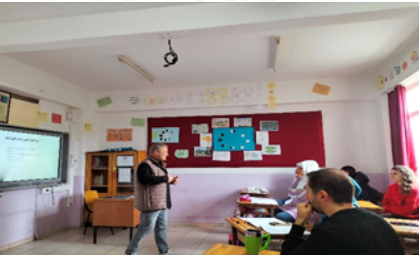
AKKUŞ KIZILELMA İLKOKULU/ORTAOKULU VELİ ÇALIŞMAMIZ

Ziyaretlerimiz sırasında veli, idareciler ve öğretmenlerimize müşavirlik hizmeti verilmiştir.