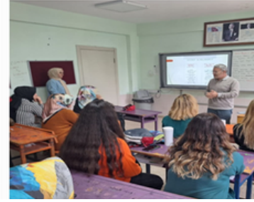
Ömer Çam İlkokulu Akpınar Şehit Fatih Güney İlkokulu